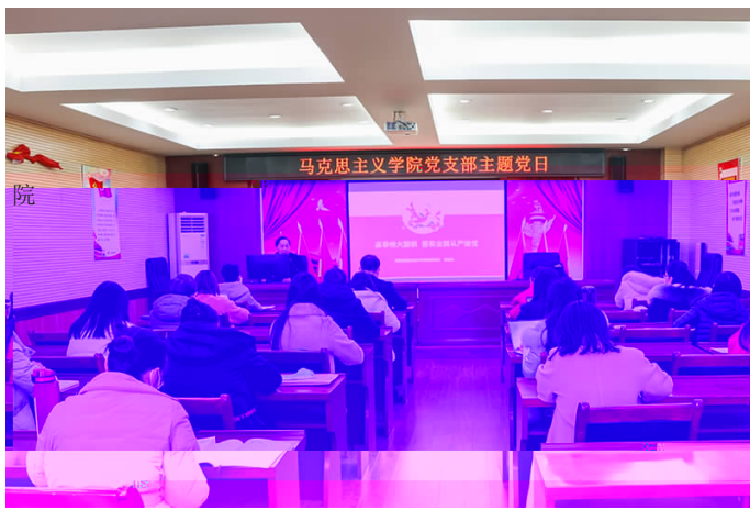
马克思主义学院党支部主题党日

思想政治理论课是落实立德树人根本任务的“关键课程”,思政教师是这一“关键课程”的“关键主体”。12月6日下午,党委书记周忠新同志以“高举伟大旗帜 落实全面从严治党”为题,在马克思主义学院党支部宣讲党的二十大精神。“学习宣传贯彻党的二十大精神是当前和今后一个时期全党全国的首要政治任务。全体党员干部要全面学习、全面把握、全面落实党的二十大精神。”周忠新指出,党的二十大报告对新征程中坚定不移全面从严治党、深入推进行进新时代党的建设新的伟大工程作出要战略部署,为全党在新起点上坚定不移全面从严治党、画了愿、指明了方向。他表示,我们之所以要全面从严治党,是因为打铁必须自身硬,从严治党是马克思主义政党的政治优势,也是实现民族复兴的根本保证;十八大以来管党治党宽松软状况得到根本扭转,是因为我们党把政治建设在首、党人精神上的、贯彻落实新时代党的、作